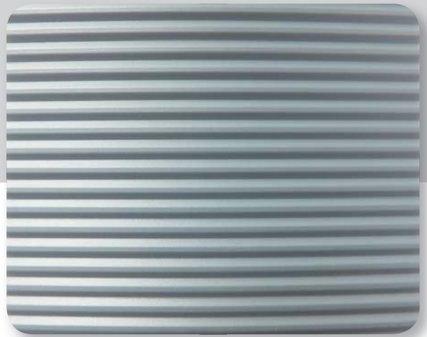
silber D silver D